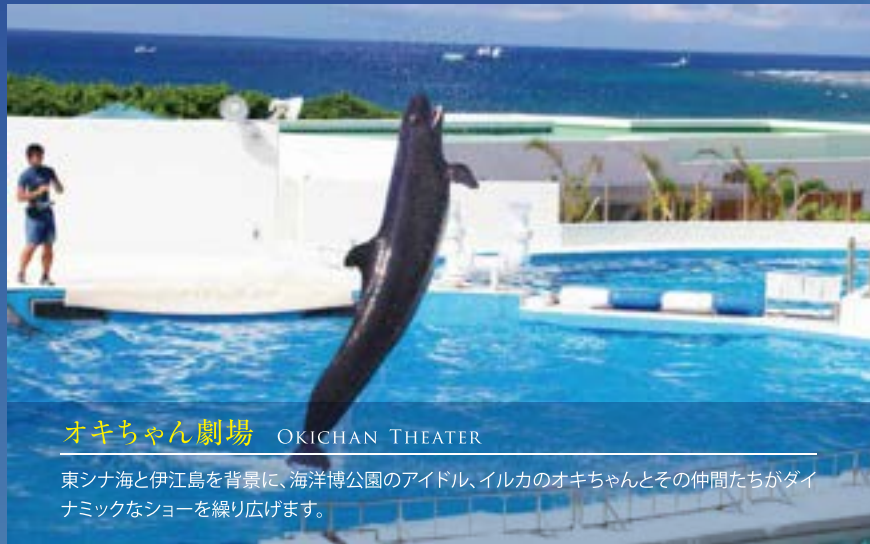
オキちゃん劇場 OKICHAN THEATER

最大恒星数1億4千万個に及ぶ美しい星空をドームスクリーンいっぱいに表現します。 ゆったりとしたリクライニングシートで、「世界最高の星空」をご堪能ください。