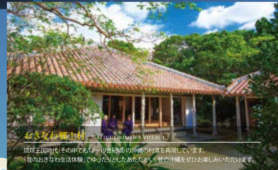
おきなわ郷土村 NATIVE OKINAWA VILLAGE

琉球王国時代(その中でも17~19世紀頃)の沖縄の村落を再現しています。 「昔のおきなわ生活体験」でゆったりとしたあたたかい、昔の沖縄をぜひお楽しみいただけます。