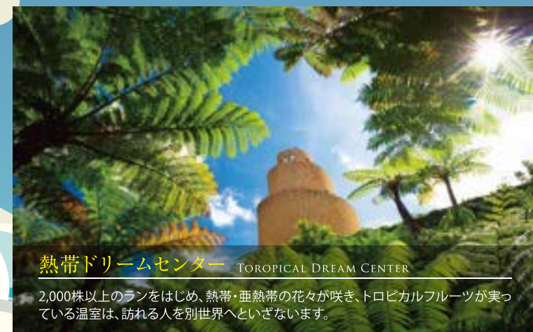
熱帯ドリームセンター TROPICAL DREAM CENTER

琉球王国時代(その中でも17~19世紀頃)の沖縄の村落を再現しています。 「昔のおきなわ生活体験」でゆったりとしたあたたかい、昔の沖縄をぜひお楽しみいただけます。